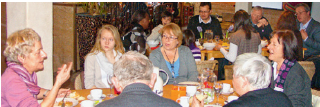
Anfang 2012 haben wir erstmals zu einem Patenbrunch in Nürtingen eingeladen, um mit Unterstützern aus der Region persönlich ins Gespräch zu kommen.

Sie möchten Erfahrungen austauschen, Ideen teilen oder eine gemeinsame Patenreise planen? Bei ChildFund haben und nehmen Sie teil an dem, was andere Paten bewegt – zum Beispiel über die Leserbriefe in den KINDERWELTEN, moderne Medien wie Facebook oder bei unseren Patentreffen.